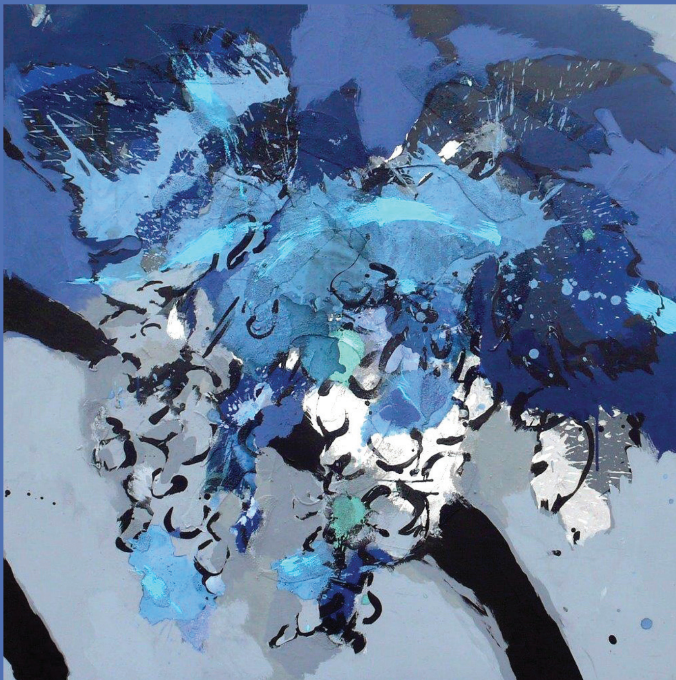
Barbara Schroder-Romat - mixte sur toile